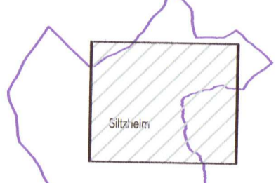
Planche : 1/1