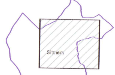
Planche : 1/1